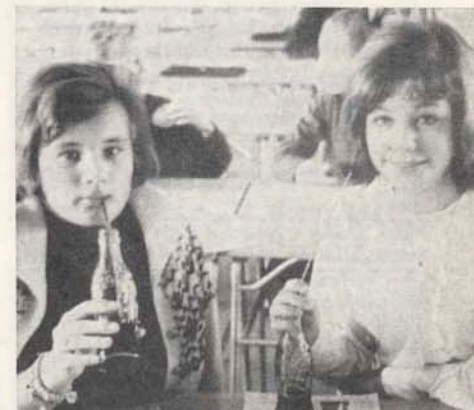
Två klassrepresentanter dricker coca-cola i pausen.

Den tredje motionen gällde en insamling till studiebidrag för en afrikansk student. Församlingen föreslog att det inte behövde vara en afrikansk student, och styrelsen fick i uppdrag att utreda om studiebidrag åt en U-landsstudent.